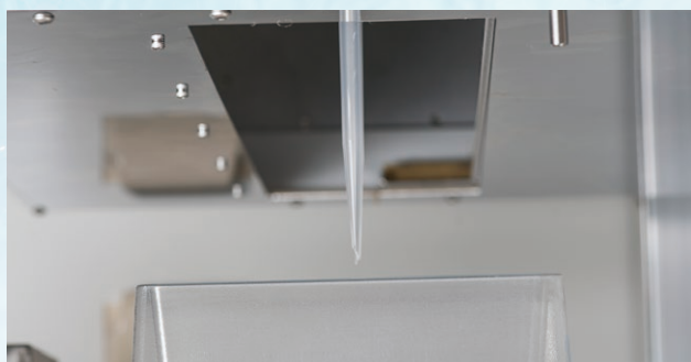
液だれ防止シャッター開口時