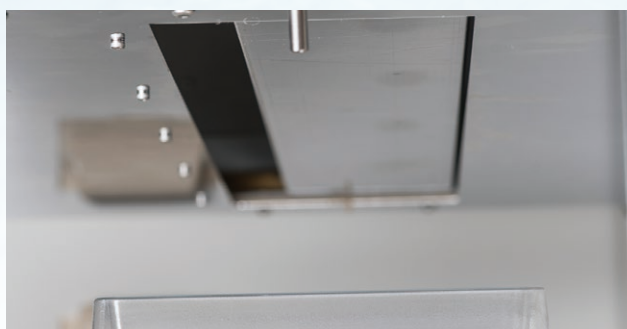
液だれ防止シャッター閉口時