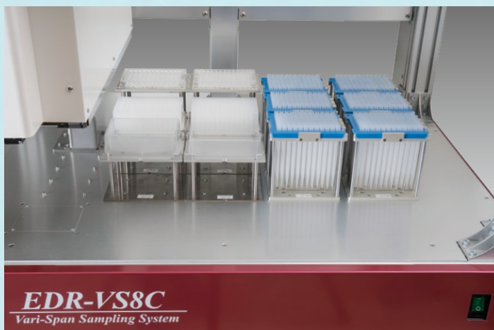
マイクロプレート15枚分のワークスペース